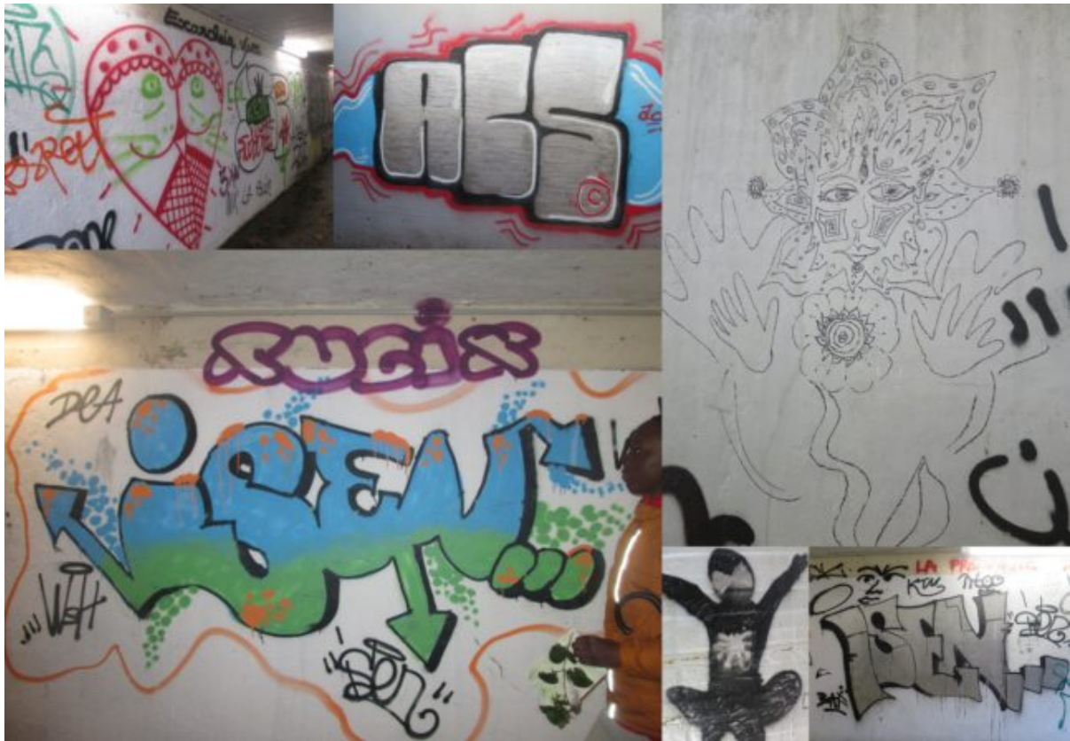
Sélection de tags

parmi tous ceux que nous découvrons dans le tunnel qui longe le lycée Malherbe. Nous nous retrouvons à la Prairie et nous voilà bientôt en train de faire notre petite traversée du Mont-Saint-Michel : le sol de l'hippodrome est gorgé d'eau. C'est amusant aussi de marcher en dansant au son de la playlist concoctée à partir de nos envies par les Caboisett.