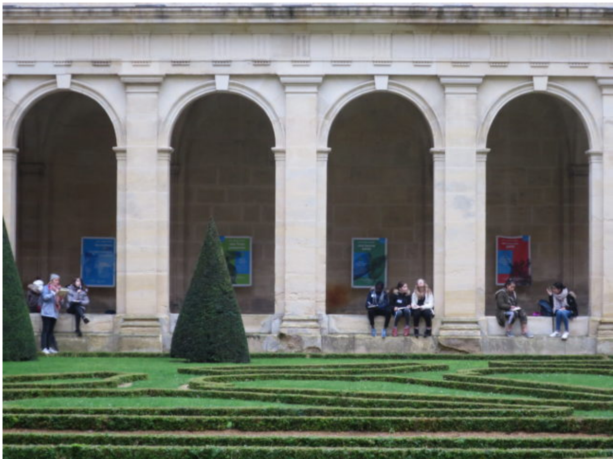
Dans le cloître

Après le pique-nique, nous recopions avec soin un tag que nous choisissons