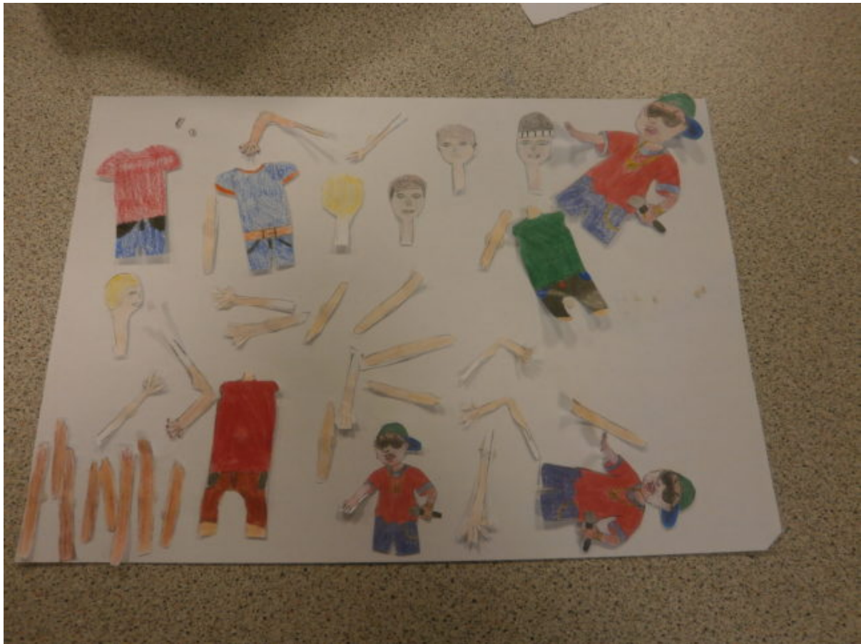
Personnage et accessoires sont minutieusement préparés