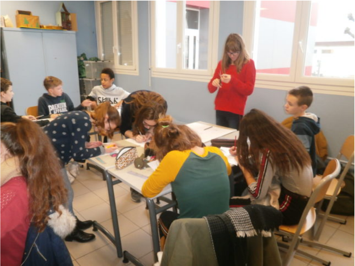
Concentration et travail minutieux