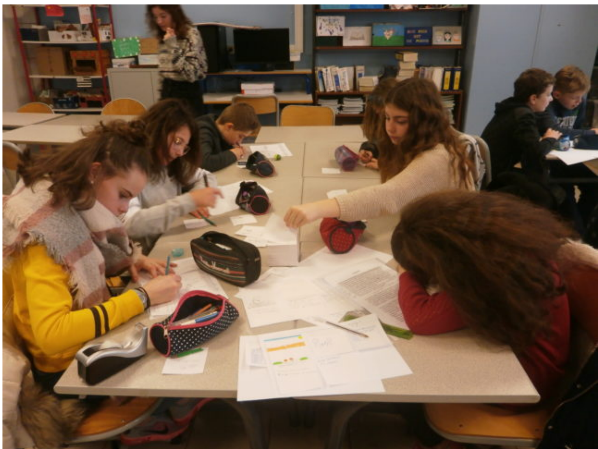
Une équipe de 5D réalisant le storyboard