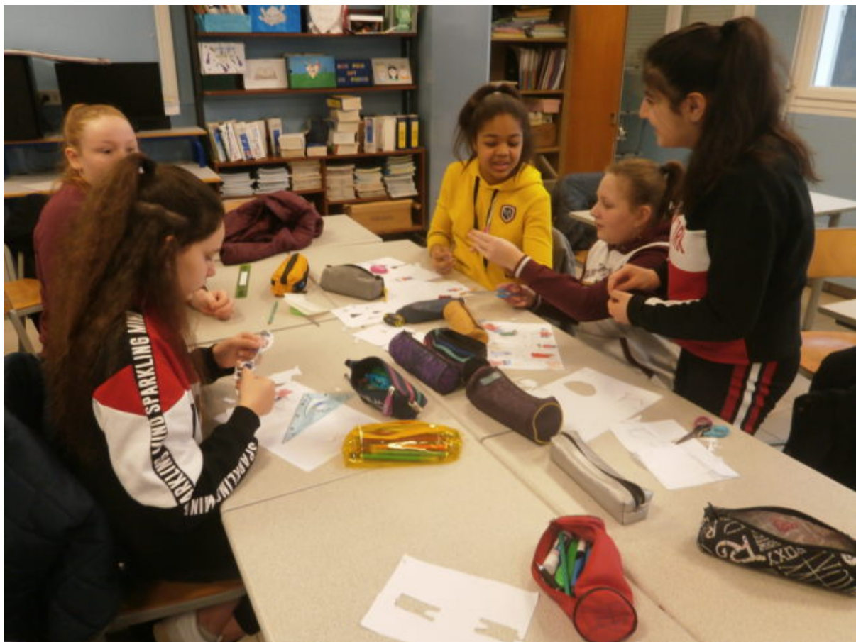
Une équipe de la classe de 5B réalisant les décors et les accessoires