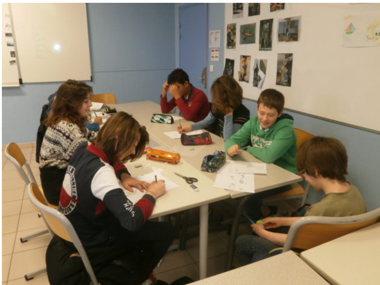
Concentration et travail collectif