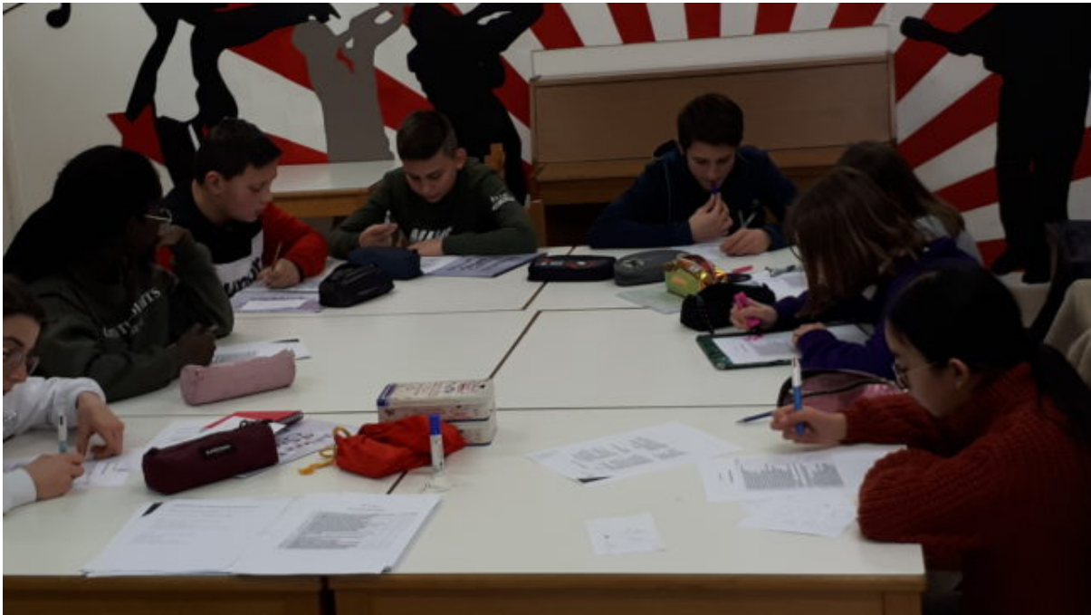
Des délégués en pleine réflexion

Mardi 04/02, les délégués élèves des classes de 5 ème ont été conviés à une formation dont l'objectif était de les aider à assurer leur mandat de délégué. Cette journée fut l'occasion de réfléchir à la fonction de délégué de classe, aux difficultés liées à la transmission de l'information et à la communication en général et de participer à des activités de coopération. Un grand bravo pour la participation active et positive de ces jeunes volontaires !