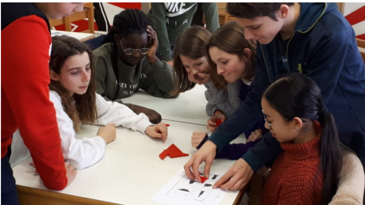
La coopération en action.