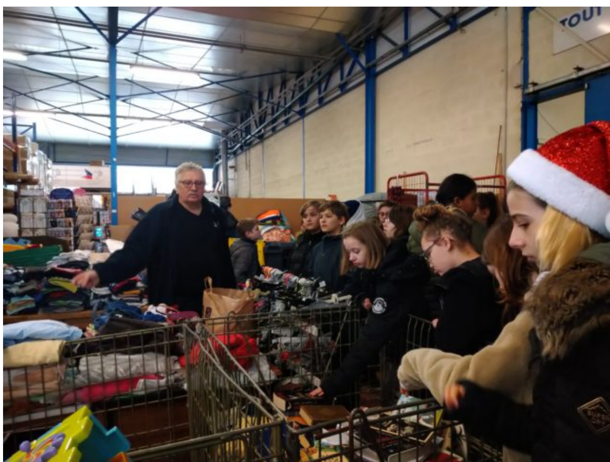
Les élèves ont visité l'antenne du Secours Populaire de Mont Coco à Caen

Avec notre classe, nous avons mené l'action du Père Noël vert qui consiste à faire des dons de jouets et de livres au Secours Populaire pour qu'aucun enfant ne soit privé de fêtes de fin d'année. Cette Association française à but non lucratif intervient sur le plan matériel et moral pour les personnes à faibles revenus.